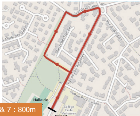
Courses 6 & 7 : 800m