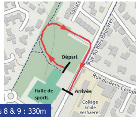
Courses 8 & 9 : 330m