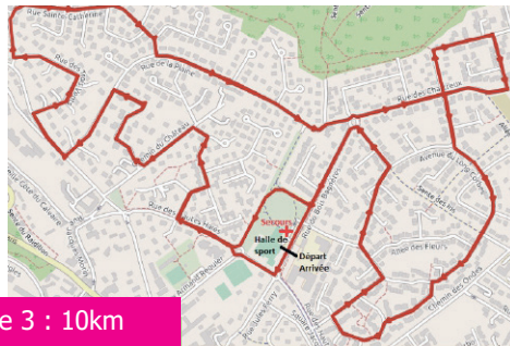
Course 3 : 10km